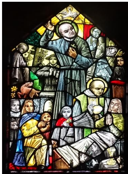
2. zijn prediking in Warschau