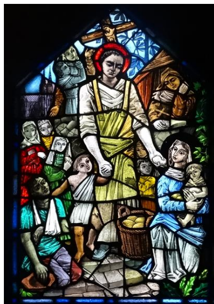
1. zijn levensfase voor het priesterschap

Clemens Maria Hofbauer (1751-1820), redemptorist, werd in 1888 zalig verklaard. In 1909 volgde de heiligverklaring.