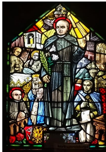
3. zijn prediking in Wenen