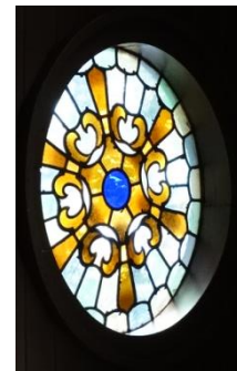
Ramen in rood, wit en blauw.