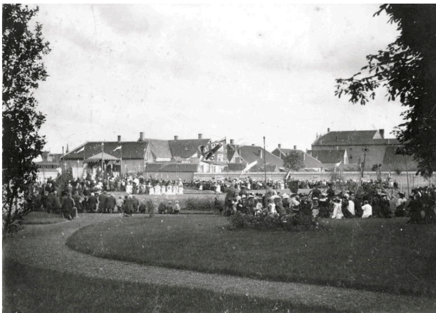
25528D (ca. 1915)