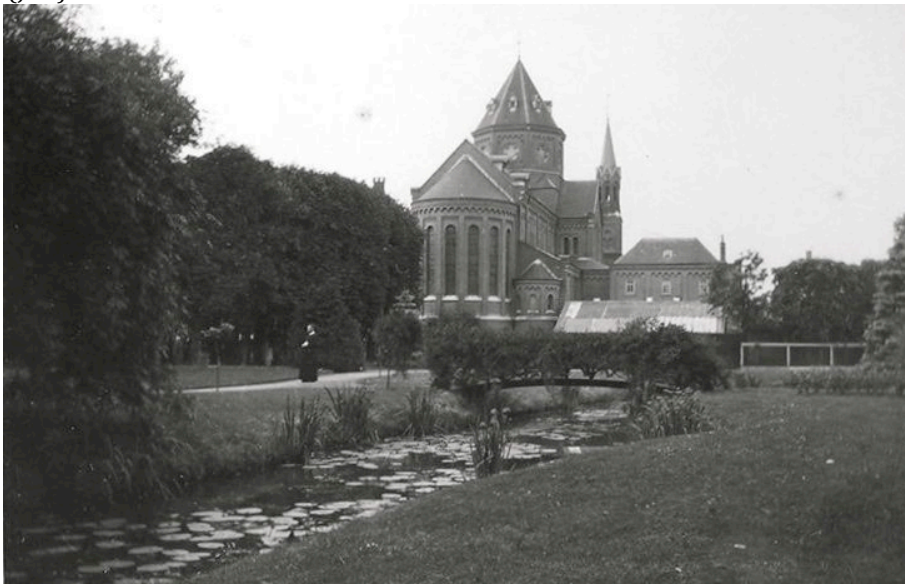
K02608 (ca. 1935)

*Het komt mij voor dat anno 1909 niet de hele zijtak van de Molenbeek gedempt is, gelet op de nog steeds aanwezige waterpartij (vijver). Een foto uit ca. 1935 laat ook nog een stuk van de "Smalle beek" zien (JvN)