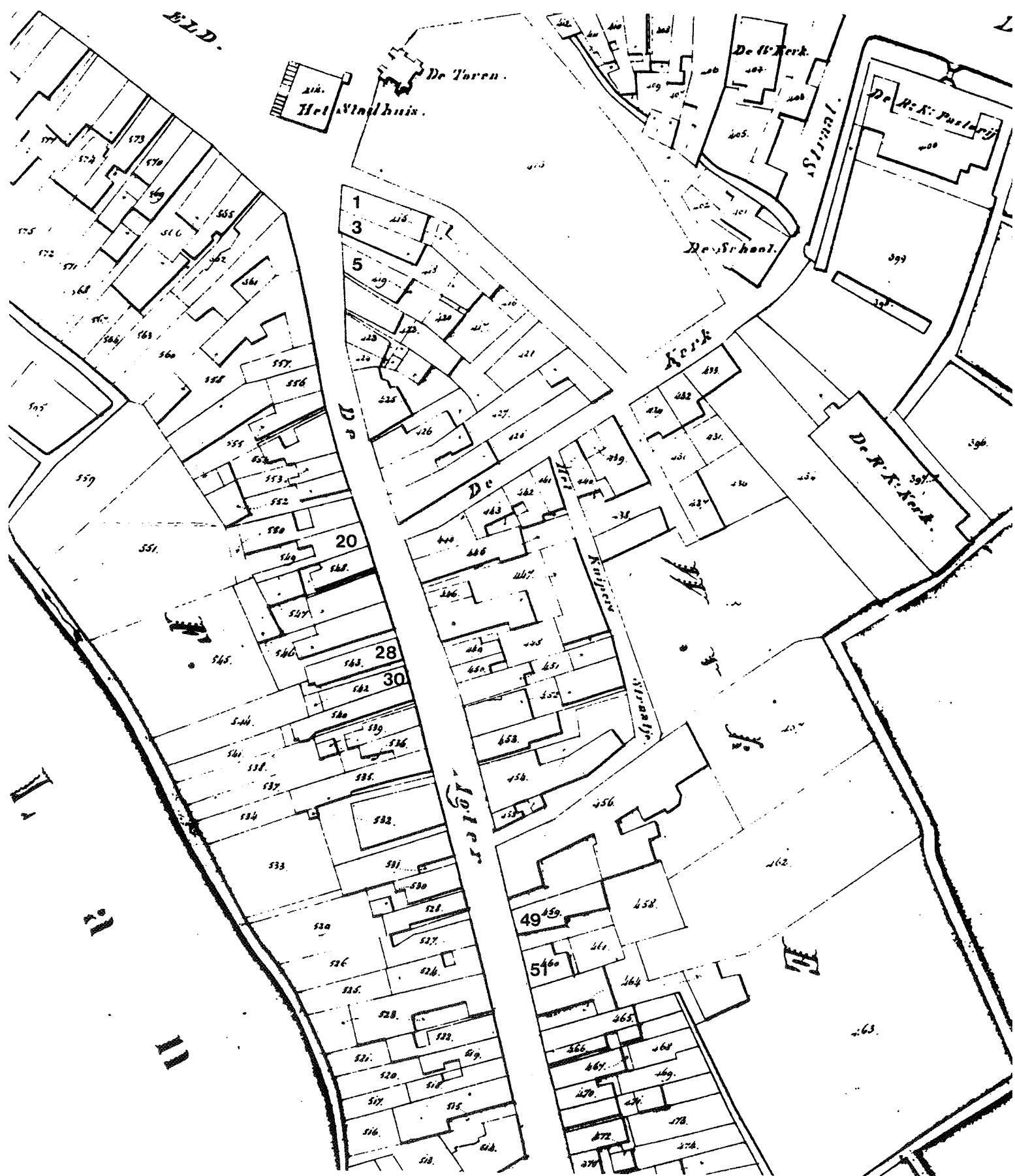
afbeelding 1: kadastrale situatie van de Raadhuisstraat in 1823 (Kadastrale Atlas Roosendaal en Nispen 1823)