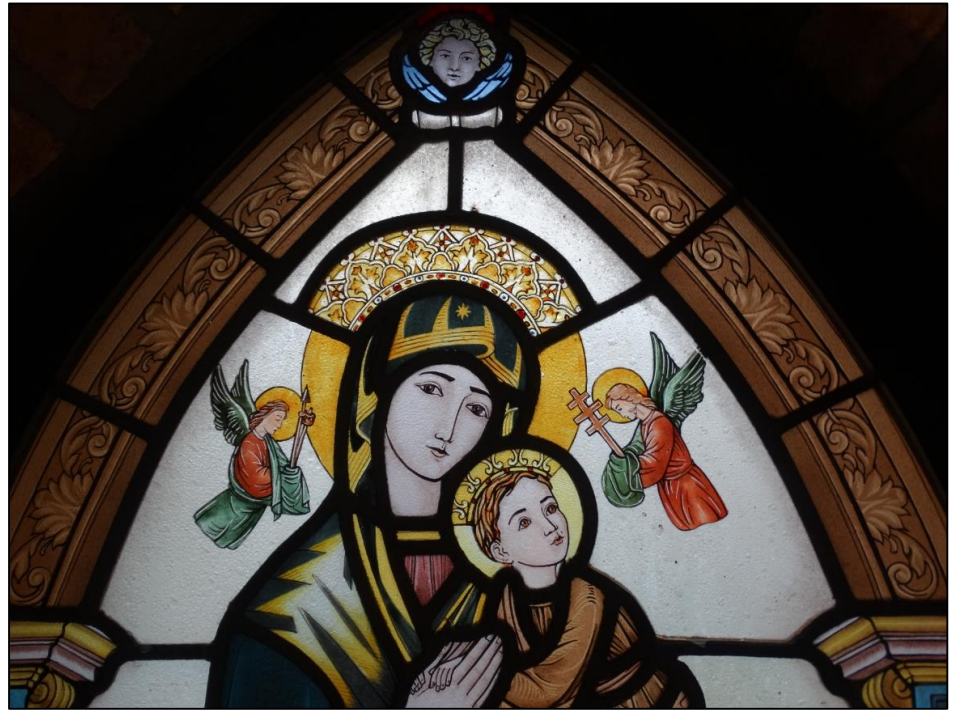
Maria en Jezus met op de achtergrond de engelen Gabriël en Michaël