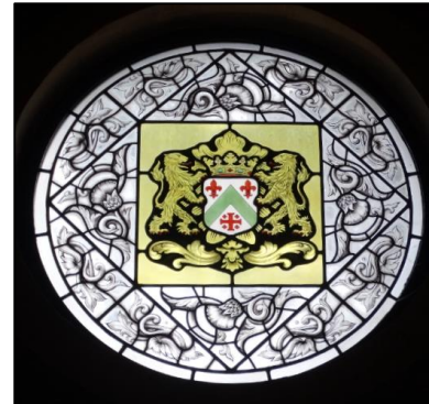
Wapen van Zundert.