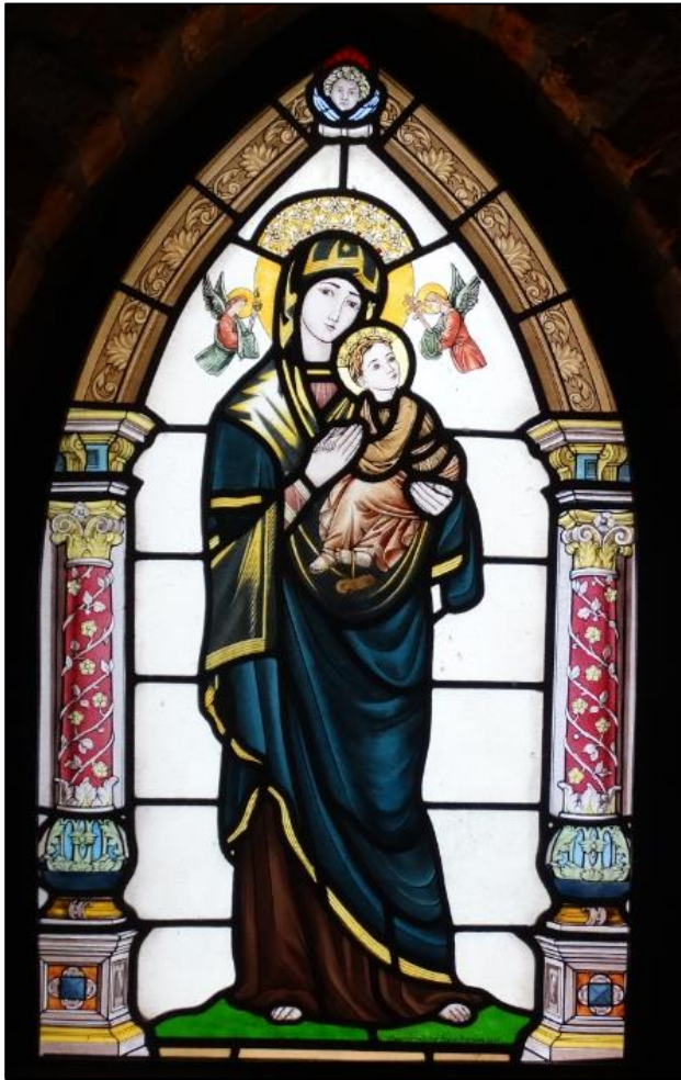
Onze-Lieve-Vrouw van Altijddurende Bijstand