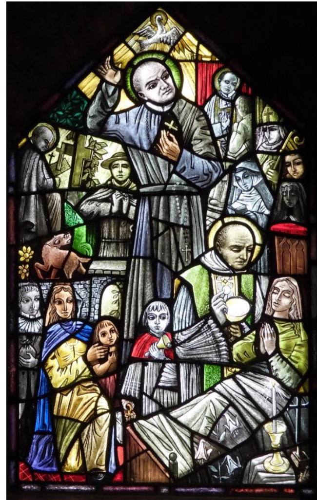
2. zijn prediking in Warschau