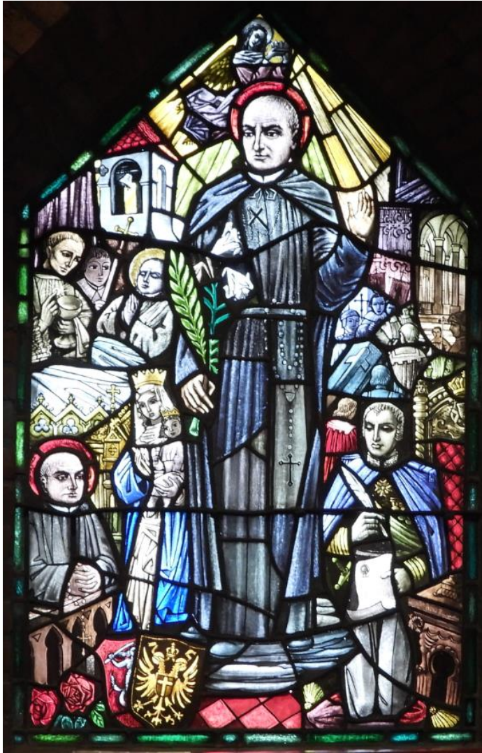
3. zijn prediking in Wenen