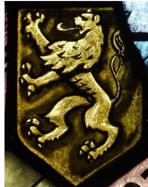
Wapen hertogdom Brabant