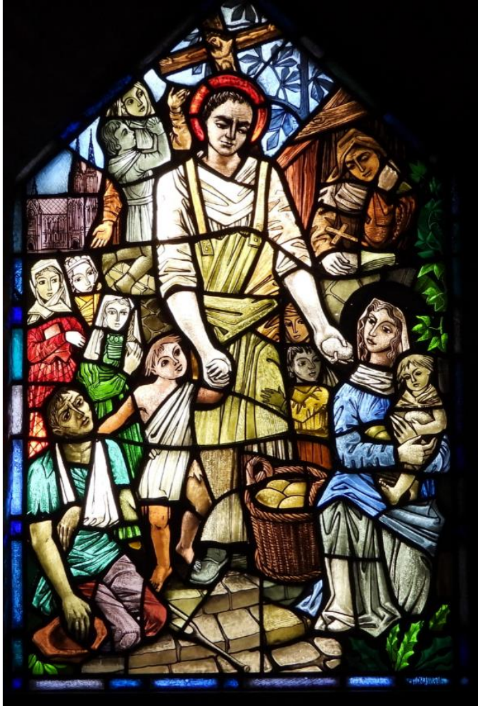
1. zijn levensfase voor het priesterschap

De vier ramen beelden vier levensfases uit van Clemens Hofbauer.