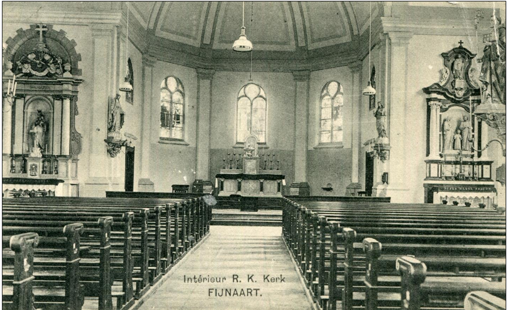
Intérieur R. K. Kerk FIJNAART.