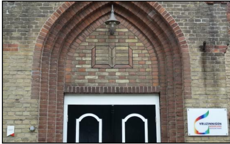
Boven de ingang het open boek.