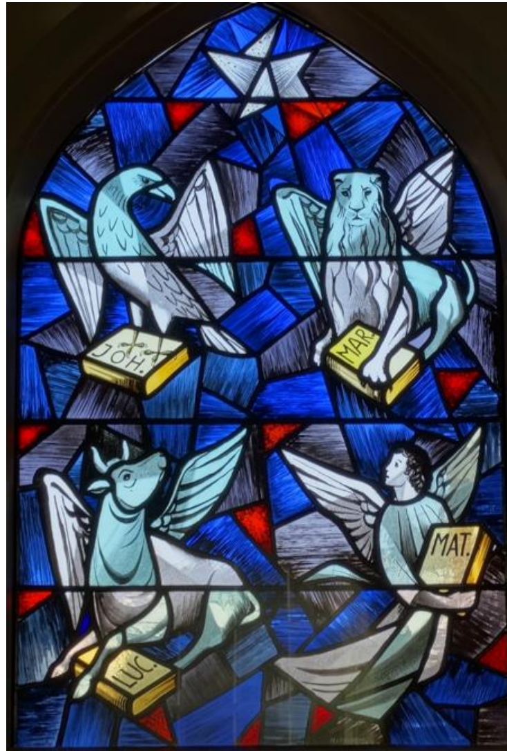
Middelste raam - Visioenen