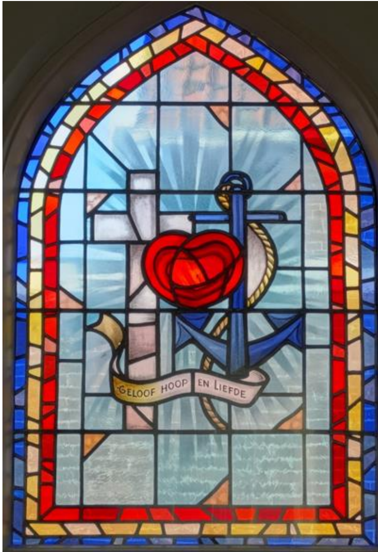
Rechter raam – Hart, kruis en anker

De ramen 1 en 3 hebben een schitterende stralenkrans. Er is voor beide ramen een zeer heldere glassoort gebruikt.