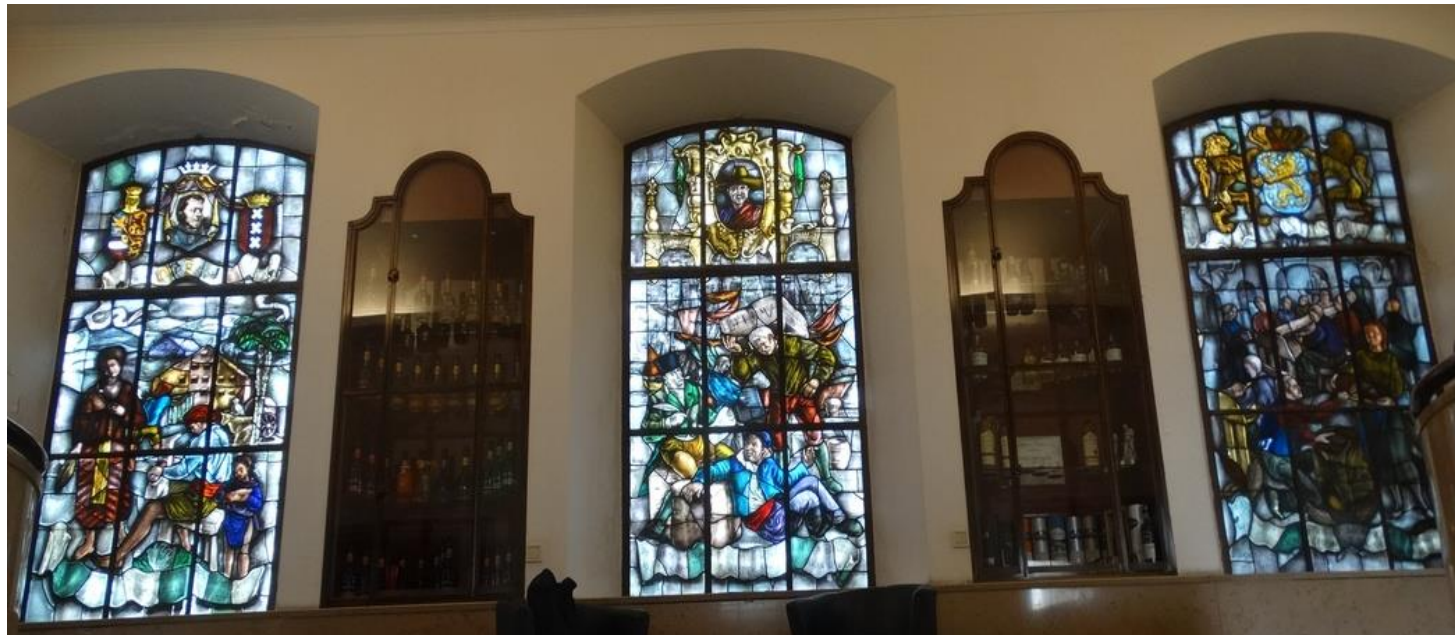
Trappenhuis Wenneker Distilleries , voorheen de KAVEEWEE fabriek.

Rond 1967 heeft Wenneker uit Schiedam zijn intrek genomen in het gebouw. (v.d. Tuijn)