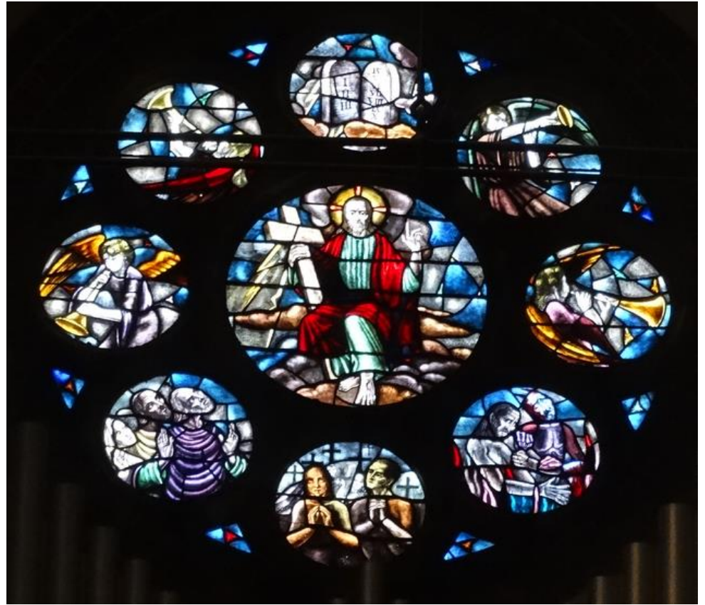
Achter het orgel 9 ramen met brandschilderingen.