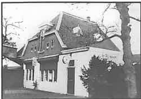
Voorgevel van restaurant de Moriaan aan het Tongerloplein

Restaurant De Moriaan kan in 1999 nog uitgebreid worden met de naastgelegen Vismarkt. Het gebouw aan de voorzijde van de Bloemenmarkt wordt in 1959 in gebruik genomen door de Nederlandse Algemene Keuringsdienst voor Zaaigoed en Pootgoed van Landbouwproducten.