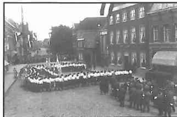
Inwijding van het pand Bloemenmarkt 12 als Eucharistisch Kruistochthuis door de Katholieke Jeugdige Vrouwen, 1931