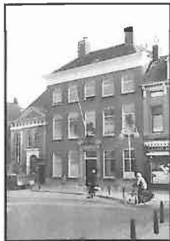
Bloemenmarkt 12, voorgevel Fractiehuis foto J.A.J.C. Verpaalen, 1993

De gemeente Roosendaal en Nispen verwerft in 1971 het eigendom om de dienst Stadsontwikkeling te kunnen huisvesten. In 1975 vertrok deze dienst naar een nieuw kantoorpand op de hoek van de Markt en de Dokter Brabersstraat. Vervolgens wordt tot 1979, de ingebruikname van het Stadskantoor, op de begane grond en de eerste verdieping de secretarie-afdeling personeelszaken en organisatie gevestigd. Op de tweede verdieping van het huis wordt vanaf 1 augustus 1975 inwoning verleend aan het secretariaat van het Streekgewest Westelijk Noord-Brabant.