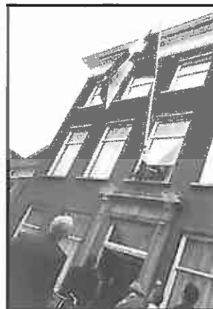
Het Fractiehuis is officieel geopend