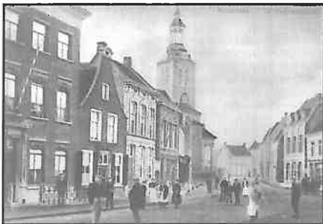
"Roosendaal – De Varkensmarkt", foto uit 1915

Deze naam blijft nog gehandhaafd bij de eerste officiële vaststelling van straatnamen door de gemeenteraad van Roosendaal en Nispen op 19 november 1898, maar moest in 1921 wijken voor de meer welriekende naam Bloemenmarkt. Ten aanzien van de locatie valt verder nog op te merken dat in de vermeldingen van oude belendingen telkens sprake is dat het pand in het zuiden door het kerkhof wordt begrensd. Het huis lag immers dicht bij de kerk en zoals vroeger gebruikelijk, omringt het kerkhof de kerk. Tussen kerkhof en huis ligt nog de loop bekend als de Paardenloop, die in ongeveer 1930 gerioleerd wordt. In de buurt staat ook de school van het dorp Roosendaal. In een vermelding uit 1724 is sprake van 'zuiden 's heeren waterloop ende het kerckhoff metten hof vande Vrijheijtsschoole'.