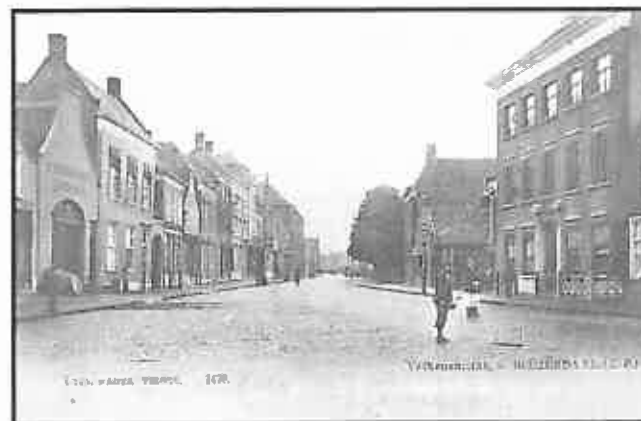
De Varkensmarkt (de huidige Bloemenmarkt), gezien naar de Molenstraat, uitgever: Nauta, 1905