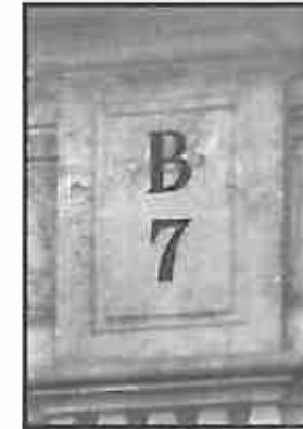
Gevelsteen B7, oude van het pand Bloemenmarkt 12, A.J.M. Mol

Aan de Bloemenmarkt 12 te Roosendaal staat naast de voormalige Nederlands Hervormde Kerk uit 1810 nog een rijksmonument met een rijke historie. Kenmerkend voor dit pand is de aanduiding van het oude wijknummer, dat uitgehouwen in steen boven de voordeur te vinden is. Dat wijknummer is nog een overblijfsel uit de tijd voor 1898 toen er in Roosendaal geen officiële straatnamen waren vastgesteld maar dat er gewerkt werd met een bepaalde wijkindeling. Die wijkindeling was overigens weer de opvolger van een nog ouder systeem, namelijk dat van de huisnamen. In het gebouw dat momenteel als fractiehuis in gebruik is, is nog een aantal karakteristieke elementen in het interieur bewaard gebleven; de fraaie zeventiende eeuwse schouw is overigens later herplaatst. In de loop der vele verschillende functies brochure worden beschreven.