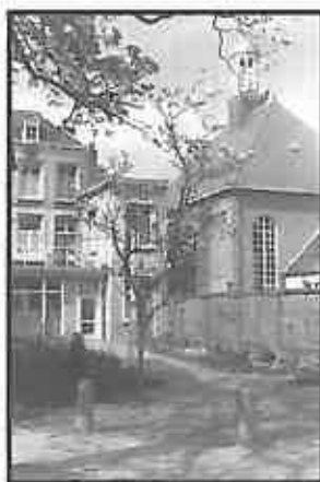
De achtergevels van links de dienst de Nederlands Hervormde Kerk 1965

Deze naam blijft nog gehandhaafd bij de eerste officiële vaststelling van straatnamen door de gemeenteraad van Roosendaal en Nispen op 19 november 1898, maar moest in 1921 wijken voor de meer welriekende naam Bloemenmarkt. Ten aanzien van de locatie valt verder nog op te merken dat in de vermeldingen van oude belendingen telkens sprake is dat het pand in het zuiden door het kerkhof wordt begrensd. Het huis lag immers dicht bij de kerk en zoals vroeger gebruikelijk, omringt het kerkhof de kerk. Tussen kerkhof en huis ligt nog de loop bekend als de Paardenloop, die in ongeveer 1930 gerioleerd wordt. In de buurt staat ook de school van het dorp Roosendaal. In een vermelding uit 1724 is sprake van 'zuiden 's heeren waterloop ende het kerckhoff metten hof vande Vrijheijtsschoole'.