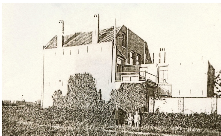
Open Monumentendag 1994